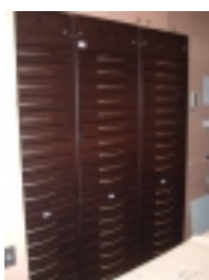
Ladekluis met 10 laden

De ladekluisen hebben een romp uit 4 mm staalplaat. Elke lade kan op verschillende manieren individueel geopend worden via een codeklavier, een afstandsbediening, een kaartlezer, ... De mogelijkheid bestaat om na opening van één lade al de andere laden te vergrendelen (inter-locking). De laden kunnen ook vergrendeld worden in geval van paniekalarm of als het alarmsysteem gewapend wordt. De ladekluis met 3 laden kan ook dienen voor het mobiel transport van waarden zoals juwelen, edelstenen,... De ontgrendeling van de lade kan dan enkel gebeuren door middel van een code gekend door de bestemming, niet door de chauffeur.